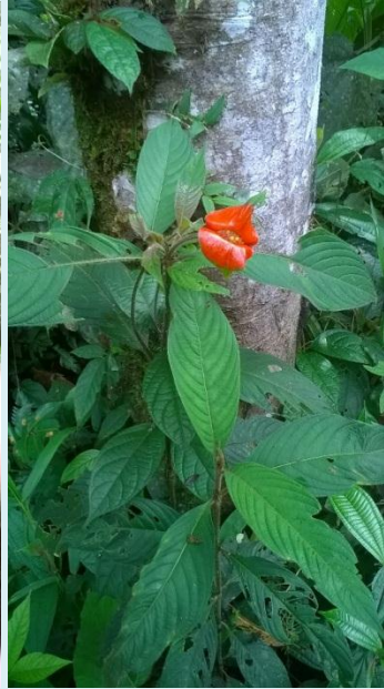
Imagen 6. Granadillo Platymiscium dimorphandrum Imagen 7. Chonta Ceroxylon alpinum Imagen 8. Beso de negra Psychotria poeppigiana