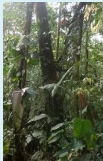
Imagen 5. Cedrillo Vochysia vismifolia