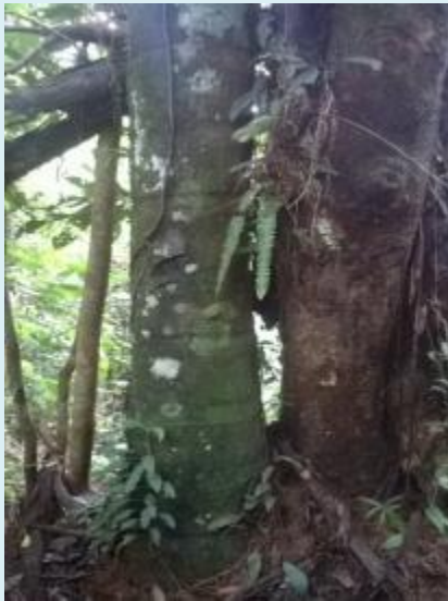
Imagen 3. Higuérón Ficus luschnathiana