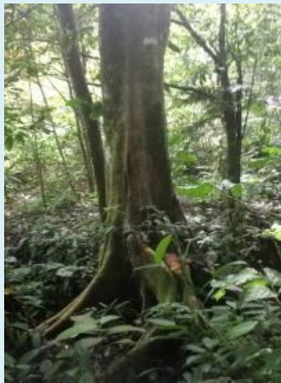
Imagen 4. Amarillo Jigua Phoebe cinnamomifolia